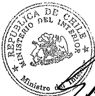
[Signature] EDMUNDO PÉREZ YOMA Ministro del Interior