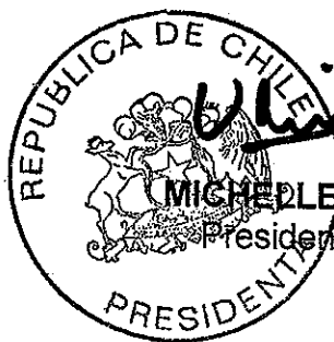
[Signature] MICHELLE BACHELET JERIA Presidenta de la República